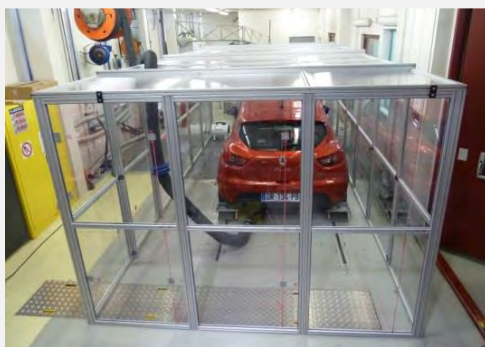
Cellule de dispersion