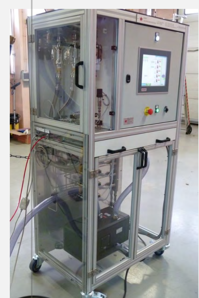
Baie de prélèvement de Polluants non réglementés