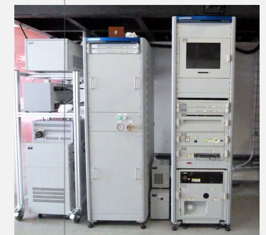
Baie d'analyse de polluants réglementés