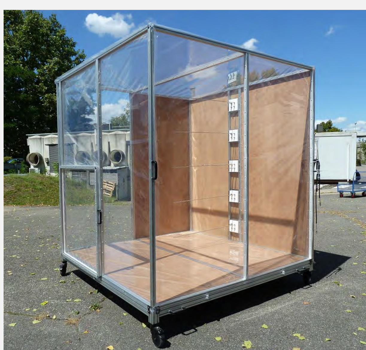
Chambre de réactivité