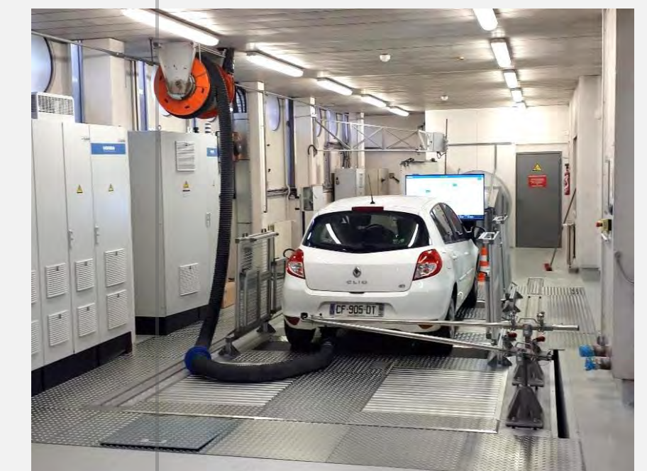
Banc à rouleaux